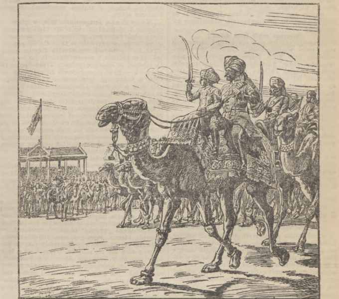
Z urzeczywistniał keranasyjnych w Delhi: Najmłodszy księga Indyjaki deflują prad królem Jerzym na czuła puchu swej jazdy wleńhądziel. (Patrz artykuł).