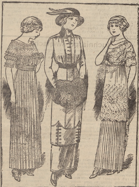
Sukienka balowa dla panny — z jasno zielonego velvetu , z rzucałkami z volle a i z wstawkami z koronek kremowych.

Jest rzeczą ogólnie znana, że kataru nabawiamy się najczęściej skutkiem przziębienia. Rola jednak zaziębienia zdaje się być pośrednią t. ulatwiająca szkodziw