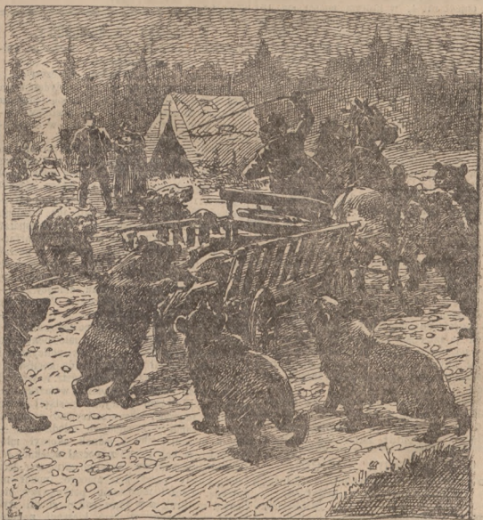
(Obis wewnątrz numeru).

Fabryczny skład Kufrów, Waliz, Toreb, Necesserów i Torebek damsk.