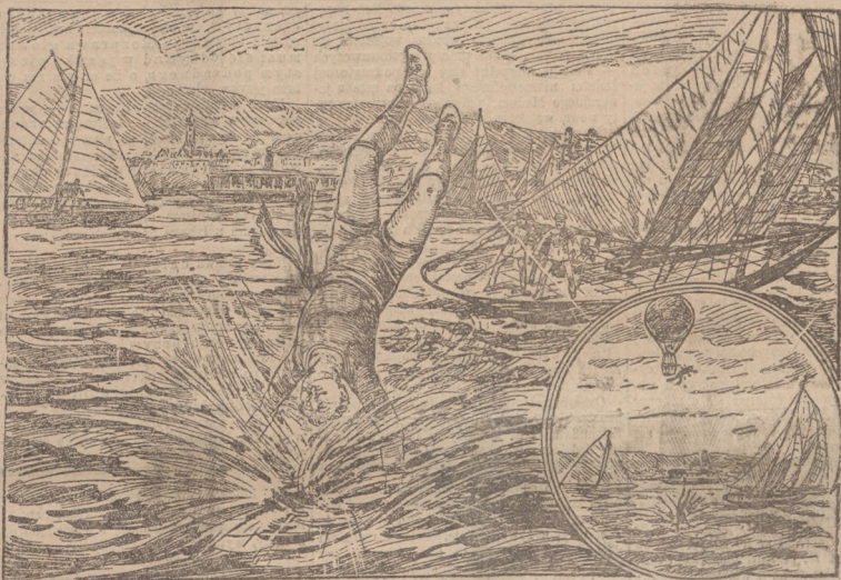
(Opis wewnątrz numeru)