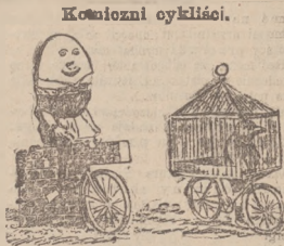
Na zabawie klubu cyklistów w Woodford (w Anglii) wielki sukces smiechom osieglu, duzo groteskowej figury, które widzimy na ilustracyi.