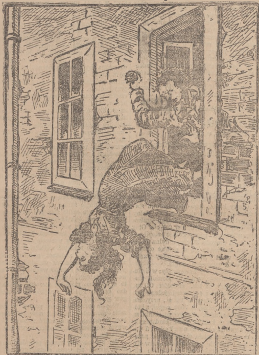
(Opis wewnątrz numeru.)