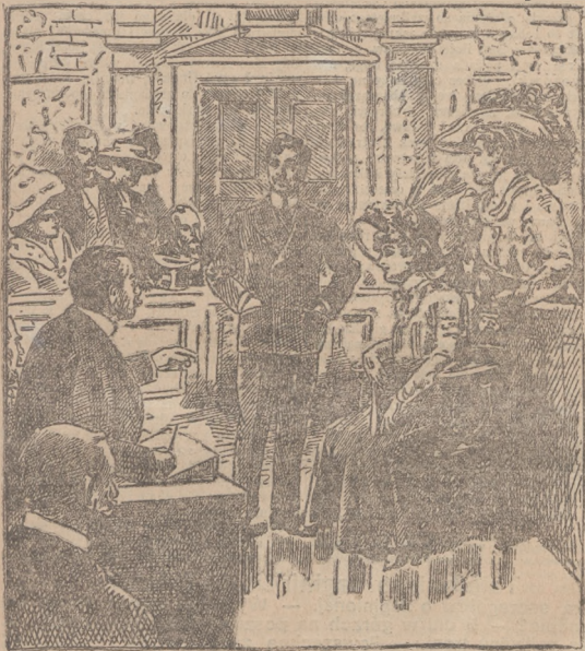
(Opis wewnątrz numeru.)