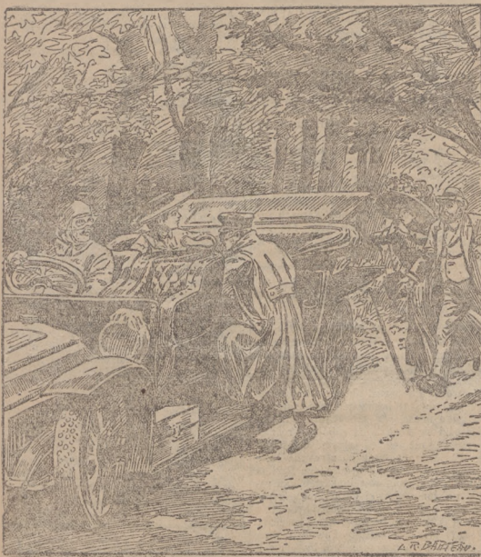
(Opis wewnątrz numeru.)