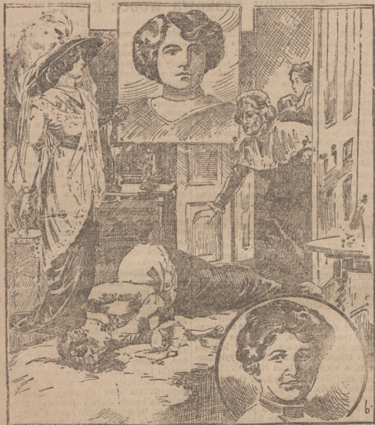
(Ciepł wewnątrz numeru.)