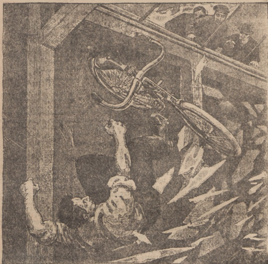
(Opis wewnątrz numeru.)