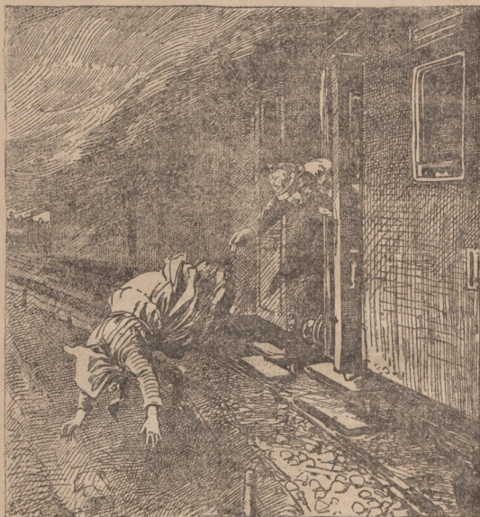
(Opis wewnątrz numeru.)

Na łeb na szyję z okna wagonu. — Karkofomna ucieczka aresztantki i szalony pościg żandarma.