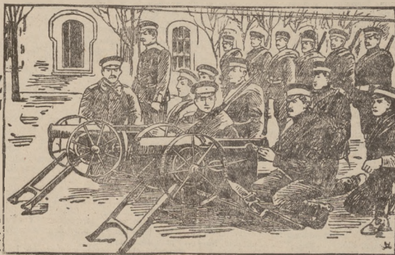
Oddział bułgarskich karabinów maszynowych.