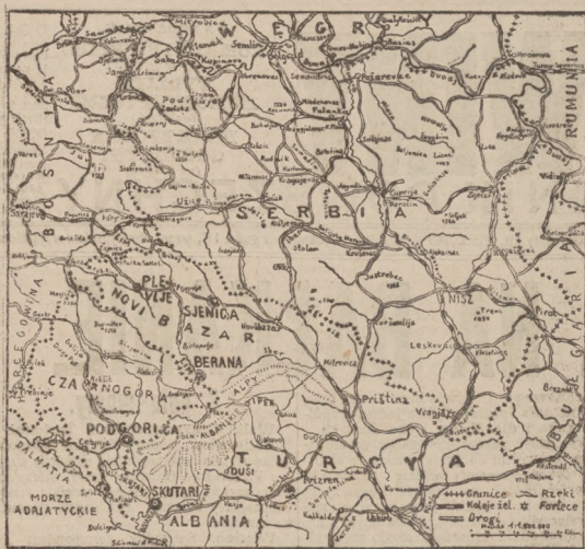
Mapa terenu wojny.

Je się już na południe od jeziora Skutarskiego i przygotowuje atak na Skutari. Główny fort skutarski Terobuz, zapoznany w ciężkie działa, może być zdobyty tylko za pomocą ciężkich dział. Kanonada rozpoczęła się dziś lub jutro.