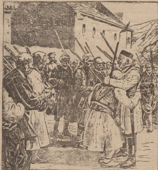
Pocalunek wojenny. Według starodawnego zwyczaju król czarnogórski Mikołaj całuje starego żołnierza idącego na wojnę.

Turcy zaś uprzedzili serbską ofensywę. Wojsko tureckie wkroczyło do Serbii i zaatakowało Serbów pod Ristowac. Cel tego jasnym. Znaczną część armii serbskiej posiadała przez Branje, Kumanowo i na Skopje. Aby ten marsz zabezpieczyć, wysłała Serbia jedną brygadę niechoty w okolicę Ristowac. Turcy atakują więc tę izolowaną brygadę w nadziei, że uda się im główną siłę serbską powstrzymać, dopóki własnych wojsk nie skoncentrują. Z Belgradu donoszą, że Turków, którzy wpadli do Serbii koło Ristowac, wojska serbskie odparły. Lewe skrzydło armii serbskiej, goniąc Turków, przekroczyło granicę i wpadło na terytorium tureckie.