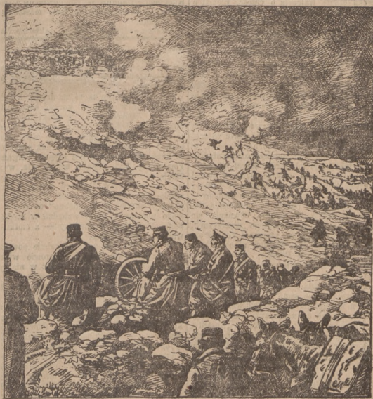
Atak Czarnogórców na fortyfikacje wzgórza Declicz (według fotografii) 8

W wiedeńskim dzienniku „Die Zeit” ogła-sza wybitny oficer armii austriackiej, jenie-