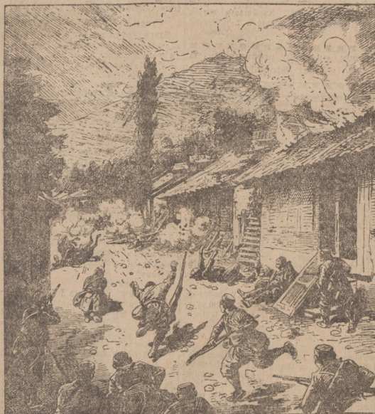
Walka w ulicach Berany w dniu 19 października (Opis wewnątrz numeru)

Dzięki zajęciu Ueskütu Serbowie w Macedonii rozpoczęli natchemiami pościg energiczny armii tureckiej Vardarskiej, która się cofa przez dolinę Vardara i przez Tetovo. Kawaleria serbska zmusiła w Tetovo większe oddziały tureckie do kapitulacji. Taki sam los grozi wojskom tureckim, które cofają się przez Koprulit. Położona armia serbsko-bułgarska już zajęła Koprulit i Istip i w ten sposób przecięła drogę Turkom, znajdującym się w dolinie Vardara. Bitwa pod