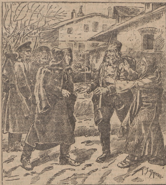
„Amiast syna ojciec. (Opis wewnątrz numeru).

Warto przypomnieć, iż w 1876 roku Serbia i Czarnogóra podjęły walkę z Turcją na własną rękę. Turcy zadali armii serbskiej cały szereg klęsk. Lecz właśnie te klęski serbskie roznieciły w społeczeństwie rosyjskim żądze zemsty i odwetu. Społeczeństwo rosyjskie na wiadomość klęsk serbskich zaczęło się domagać od Aleksandra II, by popieczęty Szwarcem bałkańskim na pomoc. Jest faktem, iż Aleksander II z rąk wcale nie zryczył sobie wojny z Turcją. Mimo to pod naciskiem podnieconej kłóskami serbskimi opinii publicznej rosyjskiej musiał wypowiedzieć Turcji wojnę. To wspomnienie historyczne daje dużo do myślenia. Nasawa ono przypuszczenie, że na wypadek okupa-