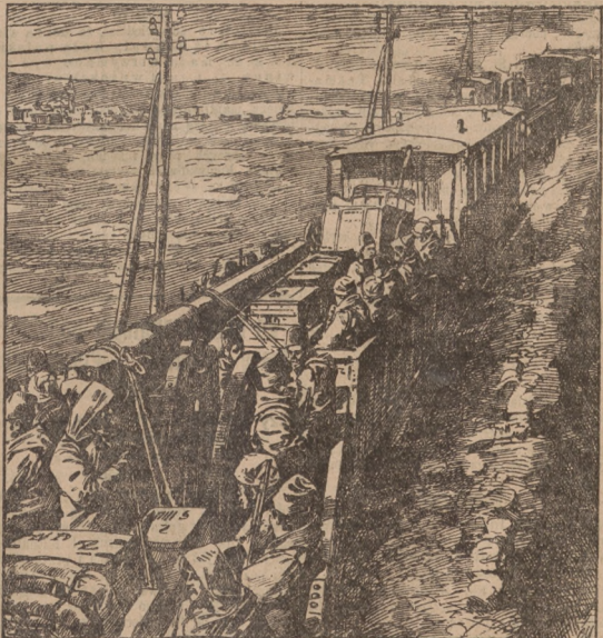
Ostatnie zbrojenia: Transport wielkich dział tureckich na linię Czatałdy. (Według fotografii).

Obrady Kolei sejmowego trwały w niedzie- lę od godziny w pół do 4 popoł. do godzi- ny 12 w nocy — i będą w poniedziałek