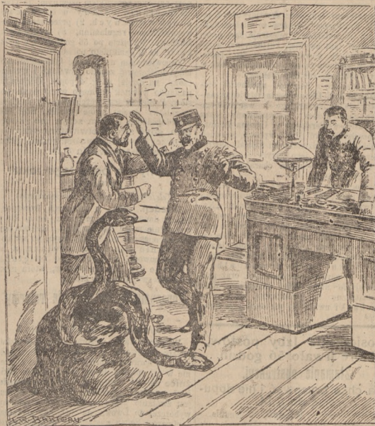
Wężę na inspekcji policyjnej. (Opis wewnątrz numeru).

Sprawozdawca „Matina” w Londynie do- nosi, iż jeden z delegatów bałkańskich o- świadczył mu, że Grecya w zgodzie z poro- zumieniem z sojusznikami nie chce podpisać sowiecizacji troni. Ze względu na możliwość pojęcia na nowo wojny, jest koniecznem, aby Grecya utrzymała blokadę wysp