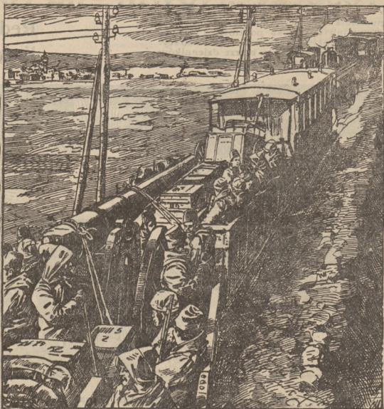
Ostatnie zbrojenia: Transport wielkich dział tarczyna na linję Czatałdy. (Według fotografii).

„Nowiny“ celują szybkością i żywością informacyi. Korrespondencyi i telefonematy wiedeńskie „Nowin“ używają już zasto- żonego rozgłosu. Wogóle „Nowiny“ pod