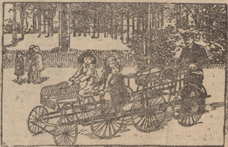
Nowe zabawy dzieci w Paryżu. (Opis wewnątrz numeru).