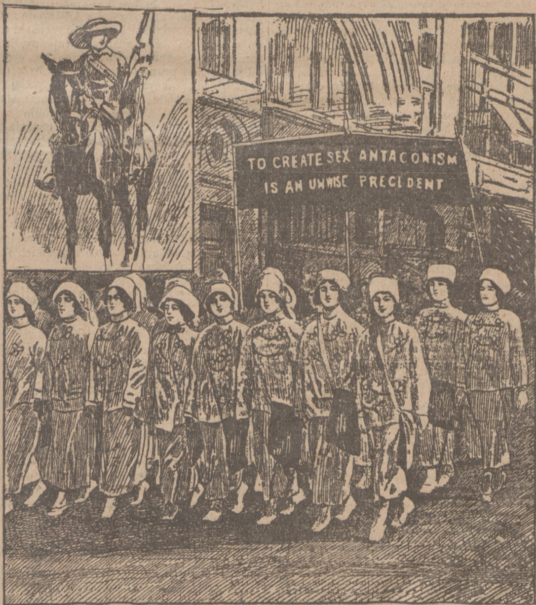
Grzeczne sufrażetki. (Opis wewnątrz numeru.)

kazał się zwolennikiem austriackiego systemu, nazwanego przez hr. Taaffe lapidarnie metodą des Fortfretens i Fortwurstelns , systemu łatininy z dnia na dzień, spekulacji, że może przecie jakoś powiedzie się wybrnąć z matni i załatwić konieczności państwowe, nie tykając zasadniczych problemów monarchii... „Jakoś to będzie“, ale czy jeszcze długo może państwo znosić taki stan wojny wszystkich przeciw wszystkim, braku śmiałej inicjatywy wewnątrz a wysługiwania się niemieckiej polityce na zewnątrz?