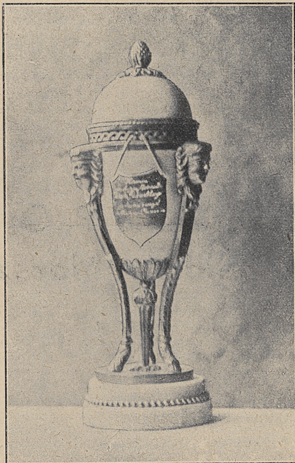
Stylowa urna z ziemią pobraną z mogił rostrzelanych Peo- waków w Żytomierzu. (Antyk z czasów Ludwika XVI-go wykonany z białego mar- nuru. Okucia z poczłanego brązu)

organizacyjnym. W obradach, z których sprawoz- danie podajemy na innym miejscu, wzięli udział wszyscy członkowie Zarządu, z ob. Prezesem na czele, delegaci oraz członkowie Zrzeszenia. Obrady te odbyły się w świetlicy Krakowskiego Koła Or- ganizacji Przysposobienia Wojskowego Kobiet do Obrony Kraju łaskawie użyczonej Zjazdowi przez Zarząd tego Koła.