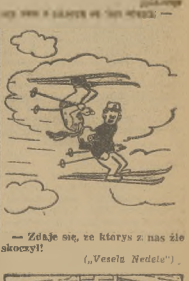
- Zdaś się, że kłarasz z nas ię skoczyć! (Vesela Nedela)