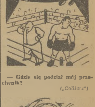
- Gdzie się podział mój pracownik? (Colliers)