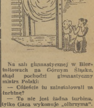
- Na sali gimnastycznej w Białobłokach... (Główna załoga spotkania Dempsey - Carpenier)