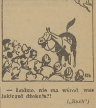
- Ładnie nie ma wśród nas jakiegóż dzokła! (Ruch)