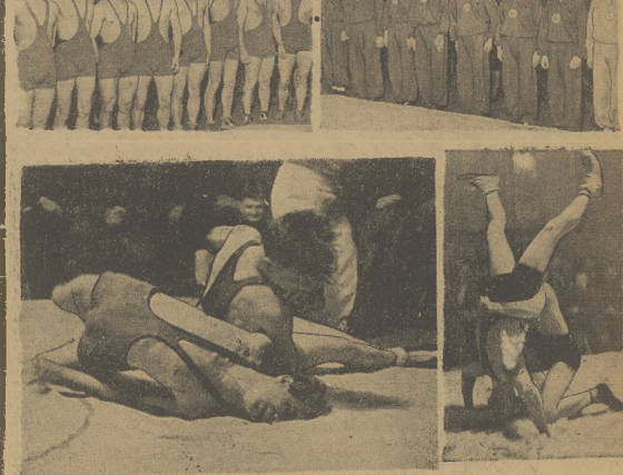
AK Kralowice, dalszej ciągłości drugą... AK Kralowice, dalszej ciągłości drugą...