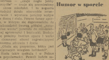
Humor w sporcie