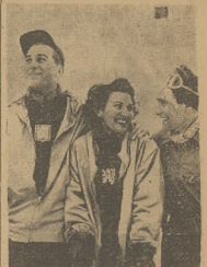
Zjazdowcy z wyjątkiem hokeistów i bobsleistów. Autor: Enzo Sestini. Fot. AFP. Sestini

bracie Mediolan — St. Moritz: Po-za tym napiszemy z Bozoni i Wenecji zgłoszenia zborowych wydziałek autokolorowych. T. W.