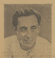
Fausto Coppi — Włochy