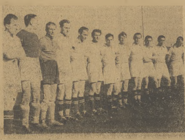
Zwycięza młodzieżowego meczu ligowego w Chorzowie przedstawiają zespół: Rucha — w góry, ponownie Garbarni krakowskiej