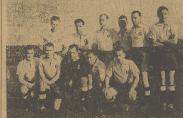
Zwycięza młodzieżowego meczu ligowego w Chorzowie przedstawiają zespół: Rucha — w góry, ponownie Garbarni krakowskiej