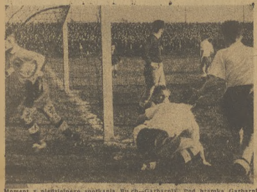
Moment z młodzieńczego spotkania Ruch—Garbarnia, pod bramką garbarni

Pierwsze siedem spotkań ligowych, wykazało z miejsca ogromne zainteresowanie piłkarstwem. Tłumy widzów zalegały boiska. Najwięcej publiczności, bo około 20 tysięcy zgromadziło mecz chorzowski Ruch—Garbarnia w Rybniku na spotkaniu Rymer—AKS, było 7 tysięcy. Nie należy zapominać, że na Śląsku odbywały się równocześnie, tj. w tych samych godzinach, spotkania A-kla sy, cieszące się również bardzo dużym zainteresowaniem. W Lipniech na no wystąpiło miejscowe Naprzód, zainicjowało się z 6000 8 tysięcy widzów. Mecz A-kla sy między Łodziem i Łodziem, także około 40 tysięcy. Razem więc na Śląsku niedługo mecz piłkarski odniósł około 70 tysięcy.