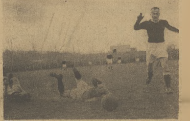
Spotkanie Witły ze słowacką Polonią odbywało się w ciężkiej sytuacji pobawionej. Odbój wypadł faul na Kubiścu, za który sędzia podjął karę straty karę.

bramką, jednak strzelił niecelnie i piłka przeszła obok słupka. Pięć minut później sytuacja była podobna, jednak przetrzebieżenie z ostatniego strzału Cieslika w górny róg. Po przerwie w drużynach nastąpiły pewne zmiany. W lewym skrzydle wystąpił Włodarczyk (Dokończenie na stronie 2)