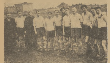
Zjednoczeni z Poznania trenowali ostatnio z rezerwową ligową Wary (3:3)