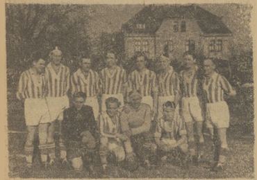
Beniaminek kl. A kl. A drużyna Kip. Dobrze się czują w Warszawie, uzyskuje dobre wyniki, na mistrzostwach i jest poważnym kandydatem do zdobycia okręgowej

Krakowski związek piłkarski buduje ośrodek szkoleniowy w N. Targu. Na ogół, jak to bywało dawniej, piłkarskie władze w poszczególnych związkach w większości ograniczają się tylko do strony administracyjno-organizacyjnej, a tylko kluby we własnym zakresie wykazywały troskę o podnoszenie poziomu technicznego oraz zdrowotnego swoich zawodników. Kluby angażowały trenerów, czy to krajowych lub, jeśli były bogate, zagranicznych. Obecnie daje się zauważyć duży pod tym względem zmiana. Kluby nadal pracują we własnym zakresie, jednak i związki nie ograniczają się do spraw biurowych i wykazują dużą inicjatywę w kierunku szkolenia sportowego, jak i wychowania ogólnego.