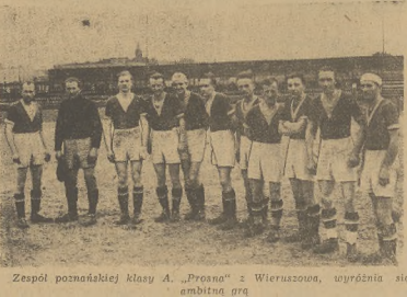
Zespół poznański kl. A „Prosta” z Wieruszowa, wyróżnia się ambitną grą