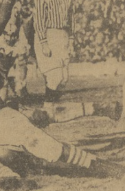
Rundy — amerykański sport narodowy nr 2. Dzielna sportowa i mas nieuprzedzone. Zdjęcie przedstawia moment z meczu pomiędzy drużyną zlokalizowaną w Ameryce