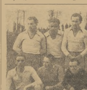
Lipowscy z Łodzi, wyróżniali się w tym roku, zwyciężąc ZKK z bytomskiej Polonii

czas przeprowadzając kursu dla juniorów w N. Targu, w porozumieniu z władzami miejskimi tego miasta i uzyskał za symboliczną opłatą 1 zł (jedną dziesiętną) 8 ha w doskonałym położonym miejscu, 2 km od N. Targu nad