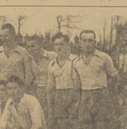
Lipowscy z Łodzi, wyróżniali się w tym roku, zwyciężąc ZKK z bytomskiej Polonii

nie nie będą czynili „aut” i nie będą podrywali ich autorytetu. Z przyczynów nad drużynami reprezentacyjnymi Krakowa należy podnieść troskę o stały napływ nowych piłkarzy. Poza reprezentację utworzone będą dwie