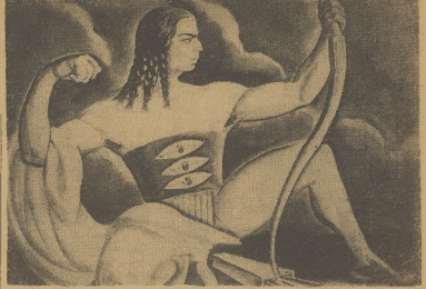
»Lurrik« — akwela prof Skoczylasa, która zdobyła brązowy medal olimpijski na Olimpiadzie w Amsterdamzie w roku 1928.

Szwajcarskiej czarnoamerykańskiej ekipy. P. Mezo, wiceprezidentem Węgierskiego Komitetu Olimpijskiego i mistrza olimpijskiego.