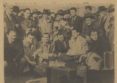
Praca (tel.) Obydli w Pradze między innymi mecz piłkarski Praga — Kraków zakończył się zwycięstwem drużyny czechoskiej w stosunku 4:2 (1:1).