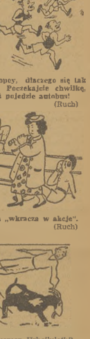
Ćwiczenia gimnastyczne „na koście” (S. Uehlelt)