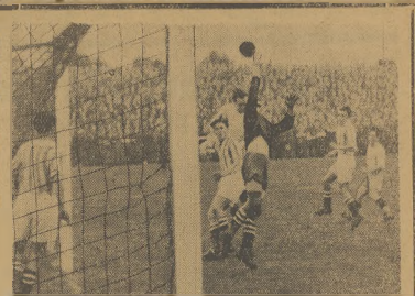
Grupa zawodników pod sztandarem AKS na czworobójnym meczu w Turynie. Muzyka assekurowana przez jedynkę broni: płaską Alzera. Z przodu Gajdak, piniusz Cielicha. W bramie stoi obrońca AKS Durniak.

W wadze koguciej Bazarnik nie (Ciąg dalszy na str. 8)