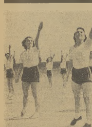
Fotografia zespołu austrijskiego w czasie Świąt Młodzieży w Poznaniu.

Celem wcześniejszego załatwienia wszelkich spraw, związanych z sponsoracją i zakwaterowaniem