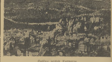
Ogólny widok Karpacza

Najpiękniejszą stacją klimatyczną na Zimnych Odzyskanych obok Szklarskiej Poręby jest niewątpliwie Karpacz, położony wśród lasów świerkowych w pobliżu największego szczytu Karłowca-Snieżki (1.605 m), z którego rozciąga się rozległy widok na najwyższe pasmo gór i doliny: jeleniogórską i kamienogórską. Przepiękne tereny turystyczne letnie i zimowe zapewniają każdemu w tym międzynarodowym ośrodku turystycznym miłą i przyjemną rozrywkę. Klimat górski przy dobrej odmianie od wiatrów północnych nie odpowiada chorym na gruczoł płuc i niewyważone wady serca, natomiast sprzyja przeprowadzaniu kuracji wyczerpanym nerwowo i fizycznie, oraz kuracji uodporniających, zwłaszcza u dzieci.