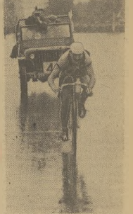
Rzeźnicki upadał na mecie w Częstochowie.