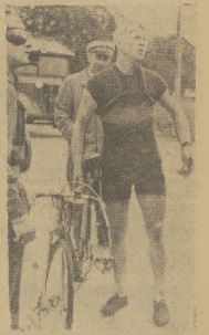
Spędził Rymdarak czas na drodze (zobaczmy na dole) na drodze Kraków — Częstochowa.