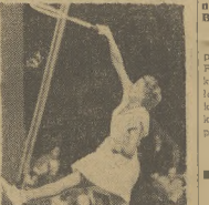
Wspaniałe występy gimnastyków sowieckich na Zlocie w Pradze. Na stronie 5

Grę do finału pokonał on swego podopiecznego Mullera, zwyciężył go pomimo Parker, Szweda, Bergströma i Szweda, Australijczyka Bromwicha. Przed kilku miesiącami Fildenburg miał wypadek samochodowy, który przekazał mu w ostatnim roku.