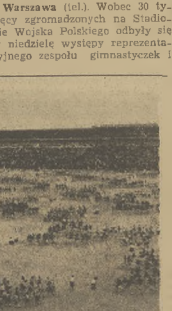
WYPRAWA Press 2 pokazowi na Złociej Sokolinie w Pradze. Cwiczenia dziewczynki i chłopcu.