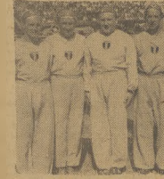
Drużyna piłki nożnej: Polak z Bytomia, która w tegorocznych mistrzostwach będzie broniła tytułu mistrza Polski, zdobytego w roku ubiegłym