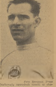
Doskonale zawodnik czeski w chodzie, Bullock, będzie drugim punktem reprezentacji CBR na olimpiadzie londyńskiej