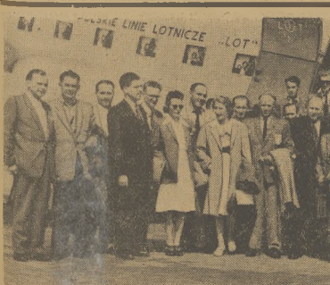
Chcieli przed startem porozumieć naszej ekipy olimpijskiej do Londynu na lotnisku Okęcie pod Warszawą.