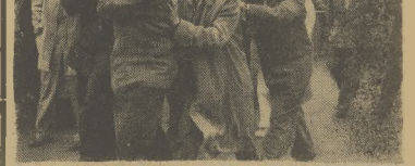
Ostatni sukces sportowy Kończaka na kortach Legii w Warszawie. Zwycięstwo nad Carulitem. Rozczniżajomousi kibice zmarł Kończaka z kortu na ramionach nie przyspuchajac, że już uduwcaż zawodnika Pogoni trzewia emtertelna choroba.

Przedził się w Bochum. Pechodnił z błędną rzeczą pamiątek. Zbiieranem chwilk dogmaty goty w utrzymaniu łecznej rodziny. Każdą wolną chwilę na korcie wykorzystywał na chwytanie rękawicy do ręki i próbowanie ermanującej go warty. Wiercić deszczki do pięknych rezultatów. W roku 1936 zdobył mistrzostwo Polski juniorów. Odtąd śwelił już liczne triumfy. Ostatecznie zakończył karierę na drugim miejscu za Skoneckim. Zmarł w 31 roku życia.