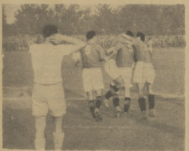
Kohut ścisnął przez kolegów po zdobytej drugiej bramki na mecz z Ruchem