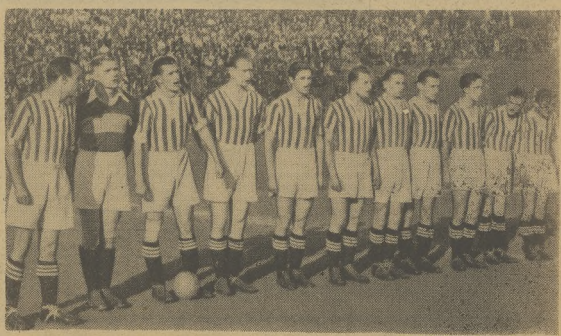
Łender ekstraklasz piłkarskiej — Cracovia