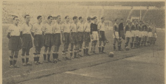
Reprezentację Polski i Finlandii na stadionie olimpijskim u Finlandków przed meczem zakończonym zwycięstwem Polski w stosunku 4:1.

Warszawa. (tel.) Na poniedziałkowy wieczór zarząd PZPN zapadła decyzja, którzy zawodnicy powołani zostają do Warszawy na mecz Polska — Finlandia. Są to: bramkarze — Skromny (Legia) i Jurwicz (Wisła), obrońcy — Janduda (AKS), Barwicki (Tarnob.) pomocnicy — Tarka (ZZK Poznań), Arpan (Cracovia), Wasiko (Legia), Gajdzik (AKS) i Winiotow (Polonia Wro.) na pastyni — Cieslik (Ruch), Kohut (Wisła), Gracz (Wisła), Opyrch (Legia), Mordarski (Legia), Sa-