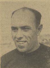
Karakulow najlepszy sprinter radziecki, mistrz Europy w roku 1947

Wszyscy sportowcy obowiązani są startować w niedzielę w marszach jesiennych