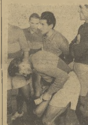
Gdy to szatni biek stolika można u ten sposób dla autograf, jak to czyni grom radzaski na chwile przed meczem w Chorzele.

W Czechosłowacji każdy uczeń chce naśladować Zatopkę (Patrz strona 5)