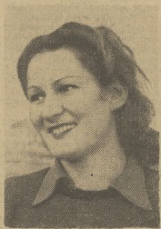
Najlepsza dyskobolka świata Nina Dumbadze