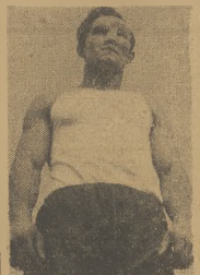
Kiszka ze Śląska najszybszy sprinter Polski.