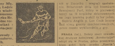
W meczu 10 listopada w Zurychu, w którym zwyciężyli Szwajcarzy 10:1.

Zurych (tel) Komitet Wykonawczy Międzynarodowego Związku Hokeja na Lodzie który ostatnio obradował, podał do wiadomości, że Niemcy nie zostały dopuszczone jeszcze do Międzynarodowego Związku Hokeja i w związku z tym nie wolno rozgrywać żadnych (owarzystwych spotkań) z Niemcami, niemiecłmi, reprezentacjami miast lub też dzielnic.