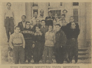
Grupa treningowa zapadłej kół klubów zakopiańskich

Treza prowadziła spód stadionu narciarskiego pod skończoną drogą pod Regienią, pod Nosal, stamtąd