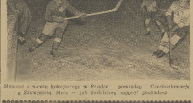
Moment z meczu hokejowego w Pradze pomiędzy Czechosłowacją a Szwajcarią. Mecz — jak podaliśmy — ugrał gospodarz