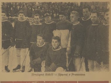
Drużyna Sokol — Sparta z Cracovia

Jako pierwszy popodnieł mecz rozegrał spotkanie między warszawską Legią i krakowską Wisłą, które