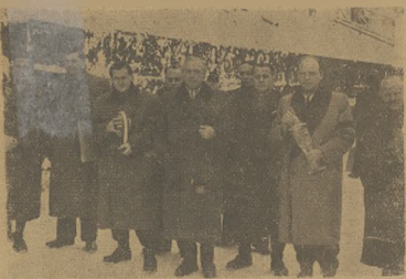
Przedstawiciele klubów hokejowych uczęszczali Jubilatów upominki, na uroczystym odpoczynku turnieju.