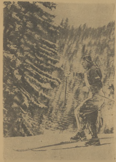
Stefan Dziedzic — Polaka — akade micki mistrz świata w kombinacji klasycznej i pospolonej, na trasie biegu zjazdowego w Szpindlerowym Młynie.