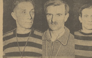
Trainerzy — umiarkowanie.

Czy droga kursu katolickiego prowadzi do regeneracji polskiego piłkarza? Czyli tak. Droga ta pójdą naprzód nie tylko piłkarze i trenerzy, ale również i i trenerzy.