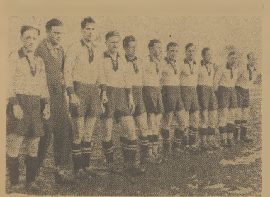
Reprezentant Kielc w II Lidze -- Gwardia przed meczem z Naprzodem