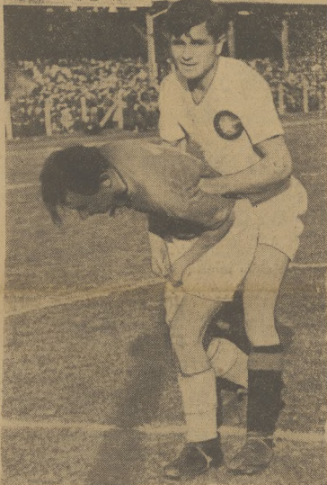
Kolejnickie pomocy po zderzeniu Polka z ZZK na niedzielnym meczu w Legii ze zwycięstwem po starciu z bramkarzem Wisły. Kubaś z Warty ponownie kontynuowanie zaliczył z boiska.