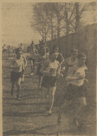
Sezon wiosennych biegów na przelaj rozpoczęła Warszawa, w sobotę, niedzielę, Kandydaci na następstwo Kusocińskiego, Nowego i Kucharskiego z grupy juniorów widzieli na trasie biegu urzędowego przejeżdżając WÓZŁA