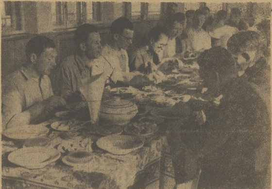
W obozie w Wiśle w Warszawie będzie miła wyżywienie. Trening do niej nie jest rzeczą lekką, toteż i w dniach zaprawne mają kolarze oparty pieruszkowate, ale też - jedzenie na obozie według zarządzącej opinii. Niezwykle dobre.