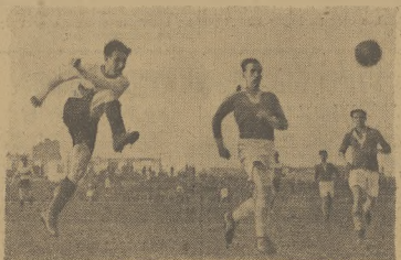
Moment z ostatniego meczu pierwszorzędnej Ligi EKS - Legia w Stolejcu, w którym niespodziewanie wysoko zwycięstwo odnieśli gospodarze.