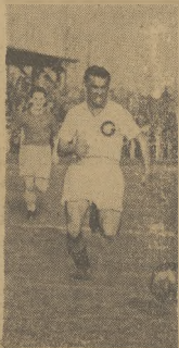
W niedzielny wieczór w Warszawie odbył się mecz o mistrzostwo województwa warszawskiego między Kolejarzami poznańskimi a Warszawianką. Wisła podobał się meczowi z Kolejarzami poznańskimi.