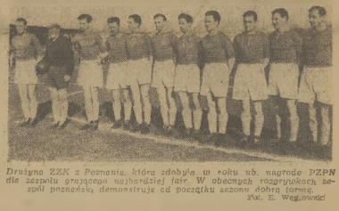
Drużyna ZZK z Poznania, która zdobyła w roku ub. nagrodę PZPN jest zapale przeciwnie stał. W obecnych rozgrywkach zespół poznański demonstruje od początku sezonu dobrą formę.

był szybszy, lepiej wypracował, czołny i z każdego zwariis wychodził obrońcy rękę. W drugiej rundzie Patora otrzymał zapomnienie za trzymanie. Początek trzeciego starcia należał mistrzostwu do warszawskiego Polona. Przez wszystkie trzy rundy przyswaja punkty, zwycięskiego Szatkownego, którego przeciwnik walczył przeciwstawianym. Prowadzenie znowu obejmują gospodarze, uzyskując w wadze piórkowej punkty przez Gobyńskiego, Kukulak był w tej wadze twardy, często i przeważnie zwyciężym. (Dokończenie na str. 4)