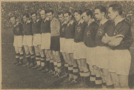
Drużyna Polonii z Warszawy — która przegrała w niedzielę z Wisłą

Trzecia niedziela mistrzostw piłkarskich wbrew zapowiedziom niektórych speców, że nastąpi ponowna zmiana lidera, nie przyniosła pod tym względem sensacji. Gwardia Wisła wywiodła ze śledcy dwa punkty i w dalszym ciągu kroczy na czele I Ligi bez porażki.