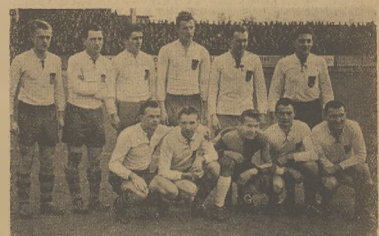
Reprezentacyjny wojskowy zespół piłkarski Czeskosłowacji ATK z Pragi, który rozegrał w czasie świąt dwa spotkania w Warszawie.

Zapowiadany przyjazd innych drużyn zagranicznych, a mianowicie dwóch zespołów węgierskich: Kécsesi i Szentlőrinc nie doszedł do skutku. Niektóre drużyny ligowe z braku przeciwników zagranicznych ograniczyły się do rozegrania meczów propagandowych na prowincji. Gracovia rozegrała dwa mecze w Rzeszowie, Lechia z Gdańska na Dolnym Śląsku. Inne drużyny, jak AKS, czy Polonia z Bytomia, rozegrały spotkania z lokalnymi przeciwnikami. Wyniki świątecznych spotkań piłkarskich podajemy na stronie 2.