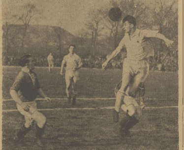
Fragment z meczu Śląsk Sosnowiec i Krakow na Stadionie w Katowicach, zakończony wynikiem remisowym 1:0. Piłkarz odparł atak Śląsk z bramki Krakowa.

KAIR. Zakończyła się na plebiscy konkursie mistrzostw mistrzostw świata — Ilości drużynowej, w którym zwyciężył zespół Włocławek. Włocławek pokonał w dwudziestym spotkaniu Francję 5:1 (3:1) i 5:1 (3:1) w meczu o troje mistrzostw świata zwyciężyła nad Belgią 3:0 (1:0) i 2:0 (1:0).