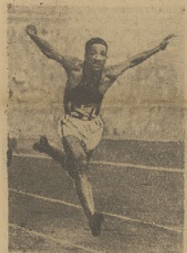
La Beach - Panama już z początkiem sezonu błysnął znakomitą formą, wyprzedzając na 200 jardów nasz własny rekord świata na 20,3 s.