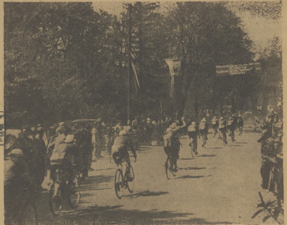
Na polskiej ziemi! Kolarków wyścigu Praga - Warszawa po minięciu granicy czechosłowacko - polskiej. Wzduchem, nawet na wietrznych trasach, witali ich serdecznie tysiączne rzesze ludności.

Wyścig Praga - Warszawa zbliża się do końca. Pozostał już tylko jeden etap z Łodzi do Warszawy, który odbędzie się w niedzielę z metą na stadionie Wojska Polskiego. W niedziele przebyli kolarków trasę z Wrocławia do Łodzi 220 km, przy czym zwyciężył Vesely (CSR), a drużyno niespodziewanie Rumunia przed Polską I, Polska I po mistrzostwach Czechosłowacji w etapie VI Katowice - Wrocław, na VII etapie do Łodzi zwyciężyła się na drugie miejsce w klasyfikacji drużynowej przed Francją I. Prowadzi nadal Francja II. Szczegółowy przebieg wyścigu i wyniki podajemy na str. 4 i 5.