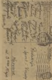
Podróżnicy kolarków, startujących w wyścigu Praga - Warszawa dla Czytelniczek „Sportu i Wzdaszy”

Wspadek wywarł straszliwy wrazenie nie tylko we Włoszech ale w całym świecie. Podkreśla się, że przez katastrofę Włochy zostały niemal pozbyte swoje reprezentacji, a FC Torino - naj lepszy dotąd w ostatnich sezonie klub piłkarski Włoch - pierwsieli drużyny i kilku rezerwowych. Niektóre nazwa przypominają że jest to już w ostatnim czasie druga podobna katastrofa lotnicza z wybitnymi sportowcami. Pierwsza wydarzyła się w śmie z częścią reprezentacji hokejowej Czechosłowacji, która leciała z Paryża na mecz do Londynu.