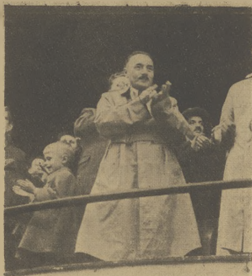
Prezydent Rzeczypospolitej, Bolesław Bierut — opiekun sportu polskiego, oklaskuje pokazy gimnastyczne na boisku w Stolicy

Należy bardziej niż dotychczas doceniać sprawę wychowania fizycznego młodzieży i ruchu sportowego, otoczyć go większą troską i opieką partyjną. W ten sposób również skutecznie służymy sprawie utrwalenia pokoju i pokrzyżowania planów podżegaczy wojennych.