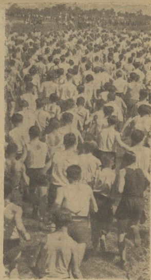
Fragment Biegów Narodowych dla mężczyzn