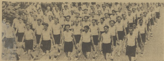
Gwardia sportowa defilują w dniu Święta Pracy