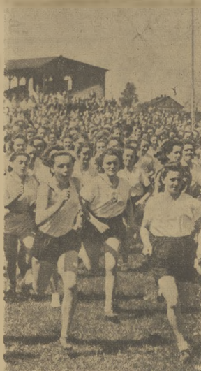
Fragment Biegów Narodowych dla kobiet