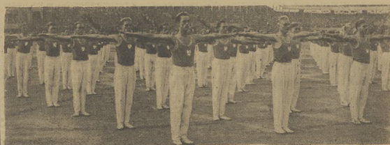
Wyborowcy: zastęp gimnastyków polskich