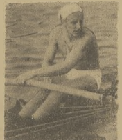
Ułatwentwony wioślarz polski K. cerka ze Szczecina, zaplanowała na następny.