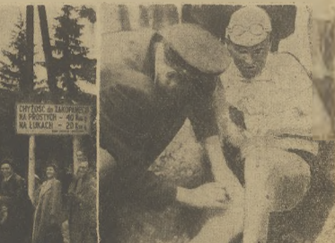
Nauczerek zapada półtoruszy na mecie w Morskim Oku; z prawej: Wygul, mda po ukończeniu wyjazdu dżem.

PARYŻ. W finałowym spotkaniu tenisowym o puchar Davisa w grze europejskiej Włochy pokonały Francję 3:2. W ostatnich grach pojedynczych Andreassar (Francja) zwyciężył Del. Batta 8:3, 6:4, 6:3, a w decydującym spotkaniu Cuccelli (Włochy) pokonał Bernarda 6:3, 6:6, 6:1.