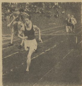
Zawodnicy do biegu na 3.000 m z przeszkodami na przeszkodzie Biernat, Kielec.

ROK III NR 60 (191) CZWARTEK 26 LIPCA 1949 CENA 15ZŁ