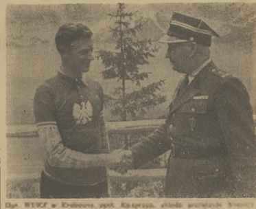
Dnia 1949 w Katowicach, górnik, zdobył mistrzostwo Polski.